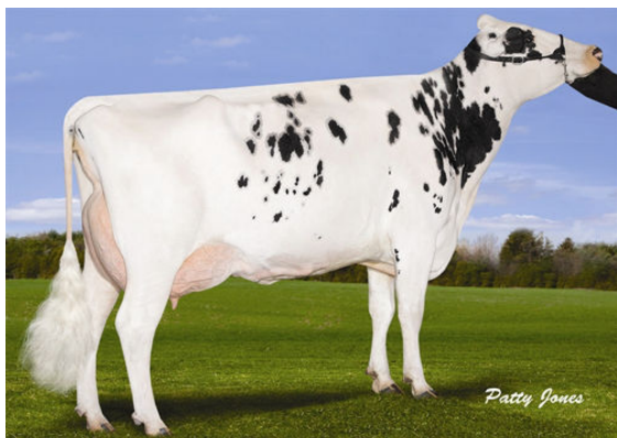
GEN-I-BEQ SHOTTLE BOMBI GRANDDAM