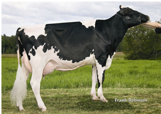
GEN-I-BEQ CHAMPION BAMBI THIRD DAM